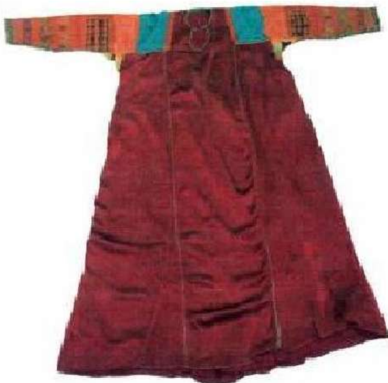
شكل (١٣) يوضح الثوب بعد عملية الترميم