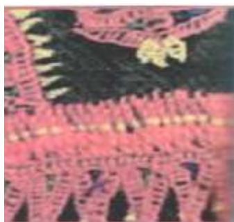
(ز٧) يوضح غرزة العريجة المتلاصقة